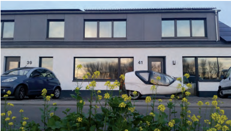
Das neue Gebäude der Passivhausexperten von IBN im November 2015

zu dämmen, um dem Brandschutz gerecht zu werden ( > 1000\text{ °C} beständig), funktionierte nicht, da die Mineralwolle nicht den notwendigen Schallschutz bietet. Die Lösung fand Andreas Nordhoff in Porenbeton mit \lambda = 0,07 . Dieser bietet den gewünschten Wärmeschutz und im Dachaufbau auch den Schallschutz und löst nebenbei die Taupunktunterschreitung. Eine Herausforderung für die Bauausführenden liegt dann lediglich noch in der sauberen Abdichtung zur Gewährleistung der Luftdichtheit.